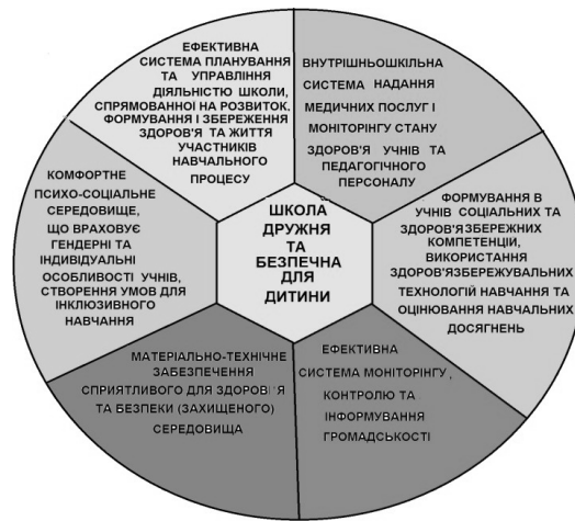
Рис. 1. Еталонна модель школи, дружньої та безпечної для дитини

Еталонна модель «Школи, дружньої та безпечної для дитини» представлена нарис. 1.