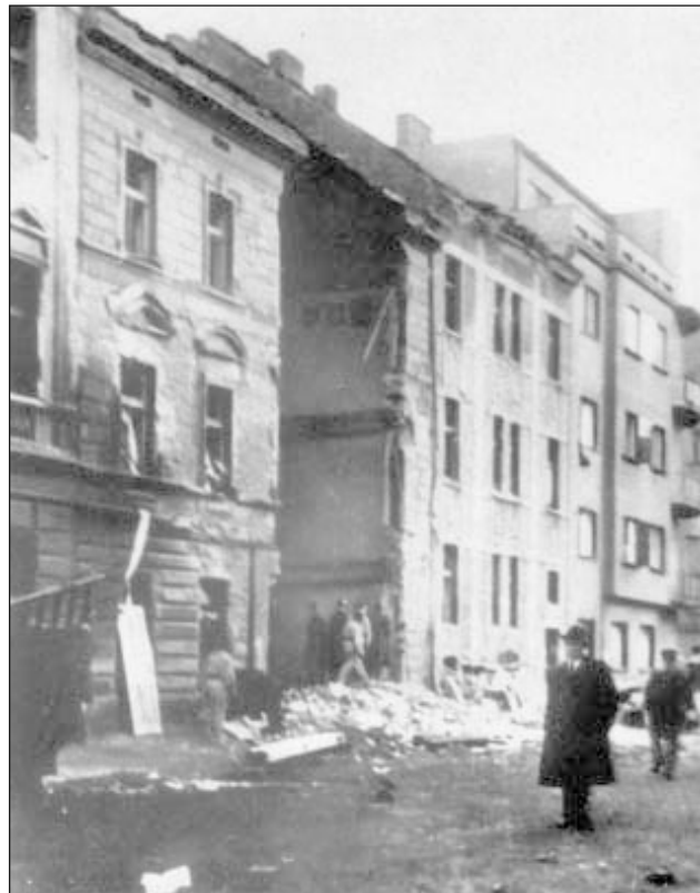
Музей визвольної боротьби України в Празі після бомбардування 14.02.1945 р. Фото