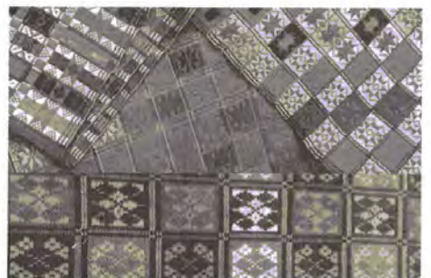
Фото 4. Фрагменти плахт. Полтавщина. Кінець XIX – початок XX ст.