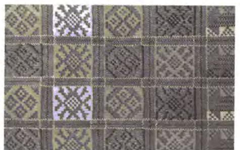
Фото 5. Фрагмент плахти. Сумщина. XIX ст.