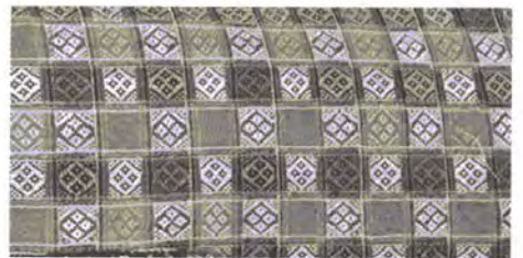
Фото 3. Фрагмент плахти. Черкащина. Кінець XIX – початок XX ст.