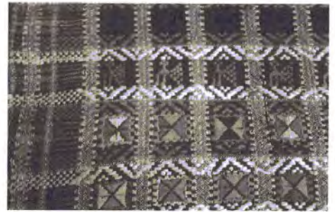
Фото 1. Фрагмент старовинної плахти, ткані на 4-ремізному верстаті

Характерними особливостями плахт Полтавщини є те, що їх ткали найчастіше на конопляній основі (коноплі вирощували майже в кожній селянській родині), на звичайному верстаті на двох або чотирьох підніжках, користуючись спеціальними «лопаточками» з намотаним різнокольоровим гарусом, яким перебирали, «затикали» зори. Ткали різними техніками, в тому числі технікою різнокольорового перебору, використовуючи вовняні нитки, гарус, шовк [3].