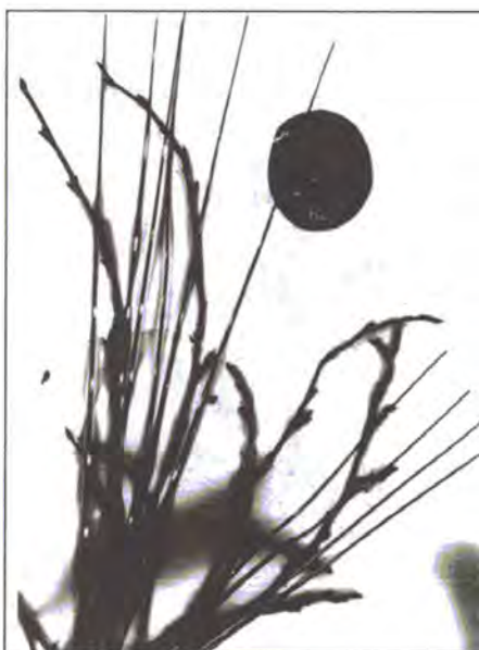
Мал. 5. «Таємниця думок»

Запропонована нами графічна техніка ксерографіки може бути ефективно використана з різною метою – навчальною (оскільки дозволяє знайомити дітей з правилами композиції, виразними засобами – ритмом, формою та ін.), розвивальною (сприяє розвитку творчої уяви, фантазії, вчить використовувати різні матеріали у творенні відтисків), творчою (розвиває творчі здібності). Долучитися до створення зображень у цій техніці можуть діти вже з молод-