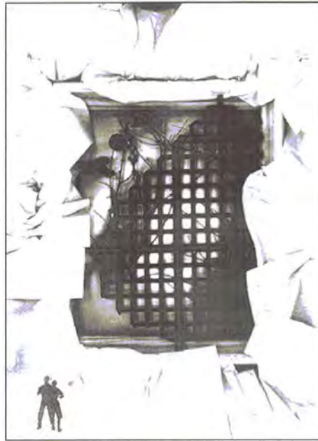
Мал. 2. «Роздуми про навколишній світ»

Нами було проведено експеримент: замість друкованих аркушів ми поклали на поверхню ксерокопіювального апарата пласкі і контрастні за кольором