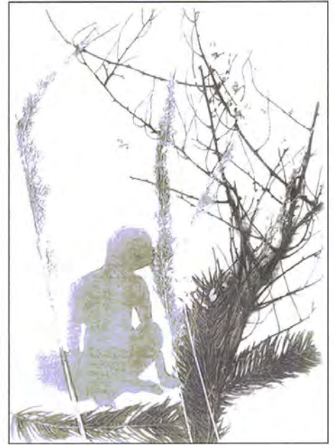
Мал. 3. «Спогади»

Для роботи в цій техніці можна використовувати не тільки ксерокс –