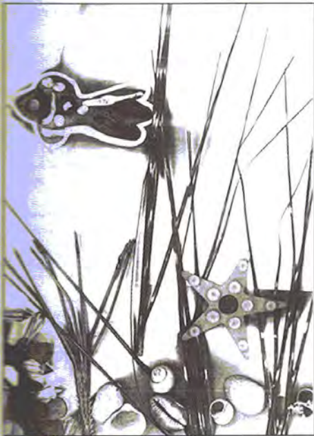
Мал. 1. «Мандрівка крихітної рибки»

вченого Аристотеля, який у IV ст. до н.е. описав цікаве явище: світло, що проходить крізь маленький отвір у віконниці, малює на стіні той краєвид, який видно за вікном. У 1727 р. лікар з Галлі Йоган Шульц проводив досліди з розчином азотнокислого срібла й крейди: коли посудину із сумішшю виставляли на сонячне світло, її поверхня одразу чорніла; при струшуванні розчин знову ставав білим. За допомогою шматочків паперу Шульц одержував на поверхні рідини силуети, а збовтуванням знищував їх та одержував нові візерунки. У кінці X ст. н.е. в роботах арабських учених з'явилися перші згадки про samta obscura (з лат. «темна кімната») – пристосування для точного змалювання пейзажів і натюрмортів. Це були перші кроки до винаходу фотографії (від грецького «світло» та «пишу»). Фотографія є сукупністю різноманітних науково-технічних засобів і технологій, які мають на меті реєстрацію одиничних довготривалих зображень об'єктів за допомогою світла. Такий же фотографічний відтиск, але в іншому форматі залишає ксерограф – копіювальний апарат електрографічного типу з порошковим елементом, що фарбує.