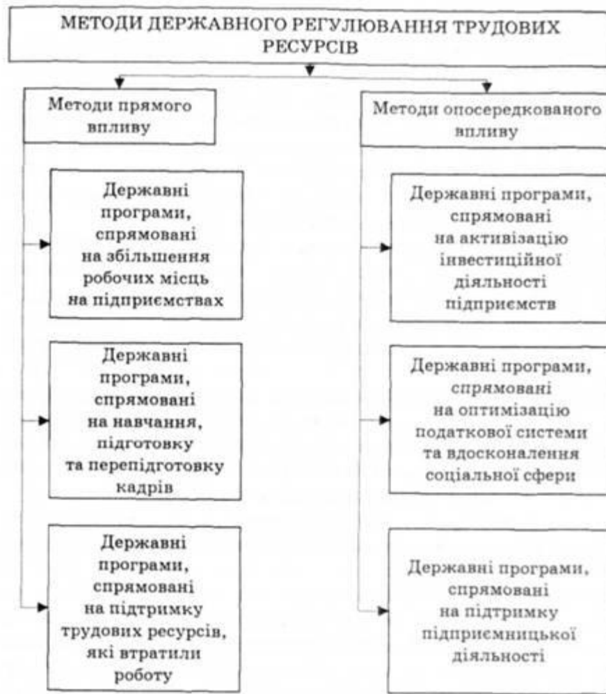
Рис. 1. Методи державного регулювання зайнятості населення

Для реалізації державної політики зайнятості населення, професійної орієнтації, підготовки і перепідготовки, працевлаштування та соціальної підтримки тимчасово непрацюючих громадян у порядку, що визначається Кабінетом Міністрів України, створюється державна служба зайнятості, діяльність якої здійснюється під керівництвом Міністерства праці та соціальної політики України, місцевих державних адміністрацій та органів місцевого самоврядування.