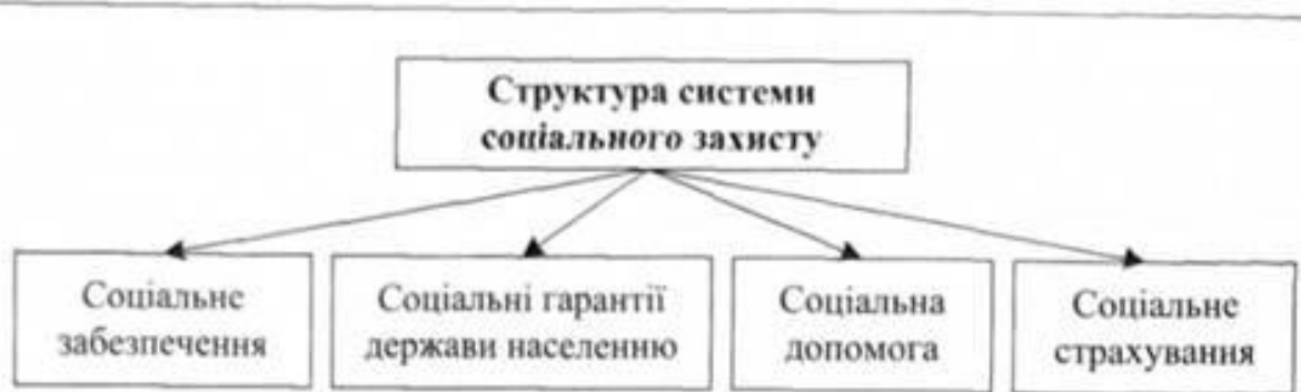
Рис. 3. Складові системи соціального захисту населення

Залежно від призначення заходів формується і структура системи соціального захисту (рис. 3, 4).