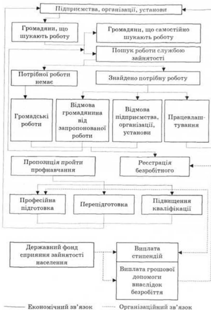
Рис. 2. Організаційно-економічна система працевлаштування робочої сили

Державний фонд сприяння зайнятості населення утворюється з метою фінансування передбачених програм зайнятості. Розпорядником коштів державного фонду зайнятості є Державна служба зайнятості. Положення про Державний фонд зайнятості населення затверджується Кабінетом Міністрів України.