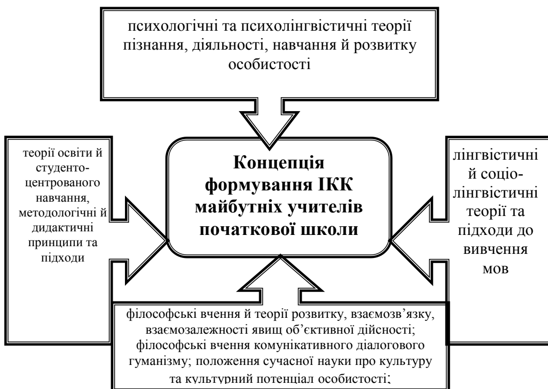
Рис. 2. Теоретичні основи концепції формування іншомовної комунікативної компетентності майбутніх учителів початкової школи

На рис. 2. графічно представлено теоретичні основи концепції формування ІКК майбутніх фахівців.