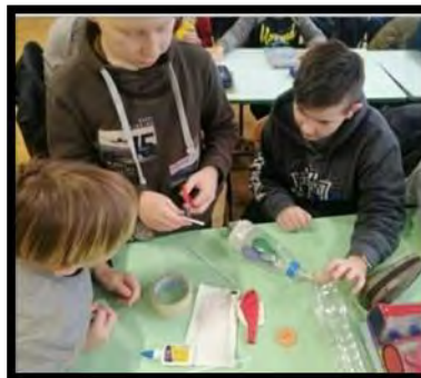
Рис.3. Робота над проектом

2. Експериментально знайди скільки подихів робиш ти за 5 хвилин. Обчисли кількість своїх подихів за 1 хвилину. Чи співпадає твій результат із заданою частотою дихання?»