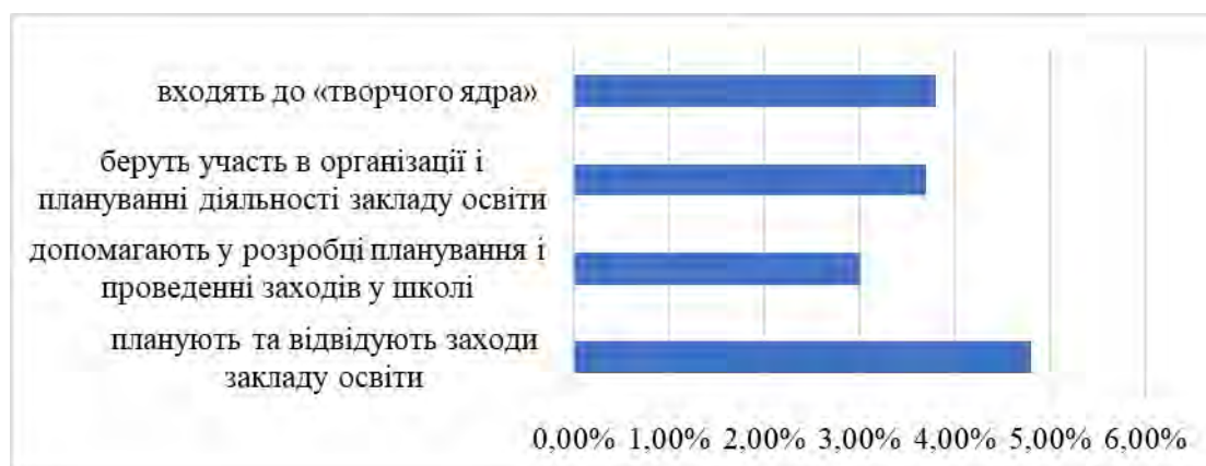
Рис. 3.5. Активність педагогічного колективу щодо участі у організаційно-педагогічній діяльності в ЗЗСО

Методи опитування щодо активності респондентів у плануванні організаційно-педагогічній діяльності в ЗЗСО дозволили виявити наступне: планують та відвідують заходи закладу освіти – 4,8 %; допомагають у розробці планування і проведенні заходів у школі – 3,0%; беруть участь в організації і плануванні діяльності закладу освіти – 3,7 %; входять до «творчого ядра» (є безпосередніми організаторами заходів в школі) – 3,8 % (рис. 3.5).