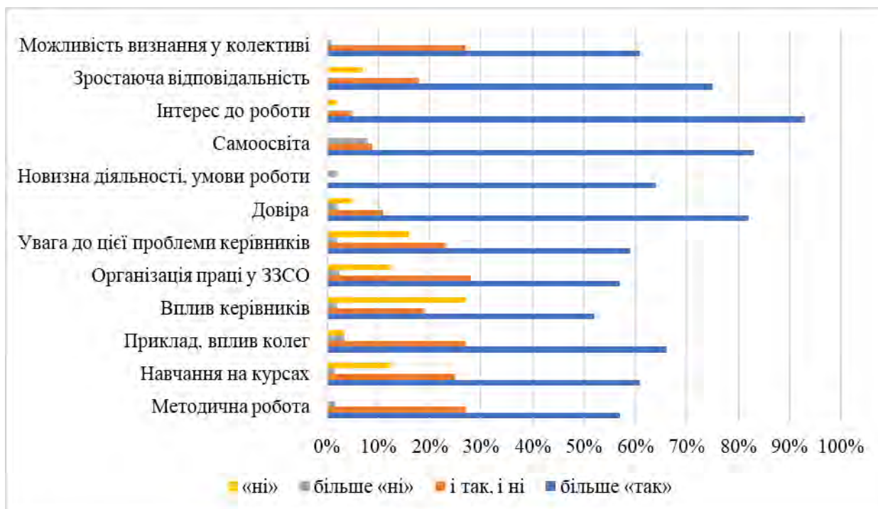
Рис. 3.7. Динаміка результатів анкетування по виявленню чинників, що стимулюють саморозвиток педагогічного колективу ЗЗСО

Подальша діагностика підтвердила, що в ході експерименту стали покращуватися показники ефективності управління школою та якість освіти в цілому. Наприклад, повторне анкетування за методикою Т. Морозової (Морозова, 2001, С. 72.). «Оцінка задоволеності роботою» показало, що колектив в середньому задоволений основними результатами своєї праці, максимально задоволений роботою адміністрації, можливістю реалізувати свої здібності, будувати стосунки з керівниками (4,4 балів за 5-бальною шкалою); 81 % педагогів (на початку експерименту таких було лише 45 %) відмітили позитивні зрушення планування організаційно-педагогічної діяльності в ЗЗСО у вирішенні питань комунікативної взаємодії керівника і педагогів. Динаміка рівнів задоволеності персоналу ЕГ і КГ ЗЗСО власною діяльністю у процесі експерименту (зміна процентного співвідношення співробітників, що позитивно оцінюють діяльність управлінської команди і характер змін, що проводяться в ЗЗСО) представлена на рис. 3.8.