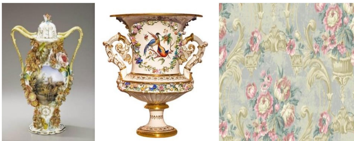
Рис. 5. Стиль рококо у виробках з порцеляни і текстилю

Надихалися художники рококо і східним декором. Відчутним є вплив китайського та японського мистецтва (рис. 5).