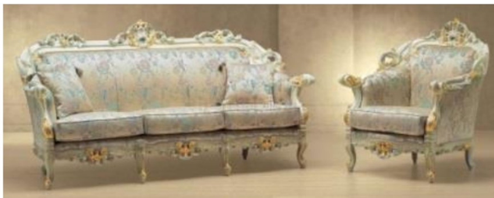
Рис. 4. М'які меблі виконані в пастельній гамі стилю рококо Матеріали Всеукраїнської студентської конференції «Перспективи модернізації підготовки майбутніх фахівців технологічної, професійної та культурологічної освіти»