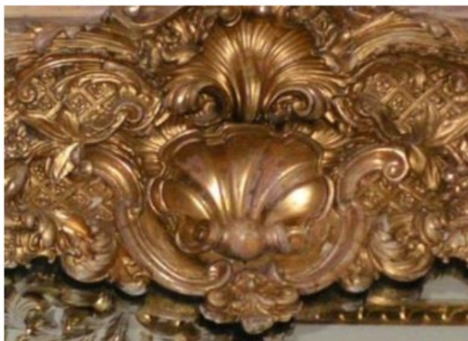
Рис. 2. Архітектурний елемент на мотив мушлі

Мушля, якою колись прикрашали гроти, відіграє у цій орнаментиці провідну роль. Якщо в орнаменті XVI ст. точно відтворюється зовнішній вигляд морської мушлі, то до початку XVIII – вона перетворюється вже в пальмету, а в мистецтві рококо – в умовний орнамент, названий «рокайлем» (рис. 2).