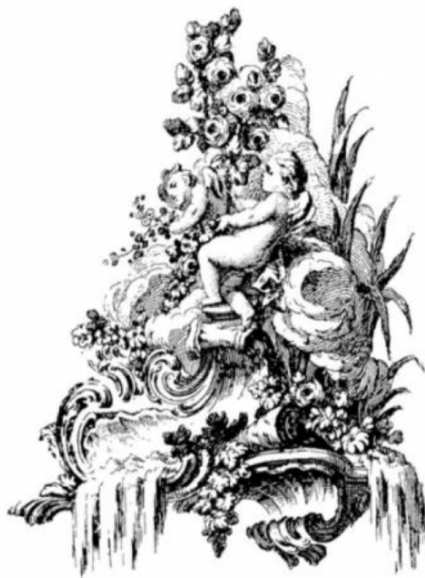
Рис. 1. Декор паркового фонтану

домінують над прямими). Химерний рококо – орнамент, в якому переважають мотиви у вигляді літер «С» – «Z» що, роздвоюється і сплітаються між собою [4].