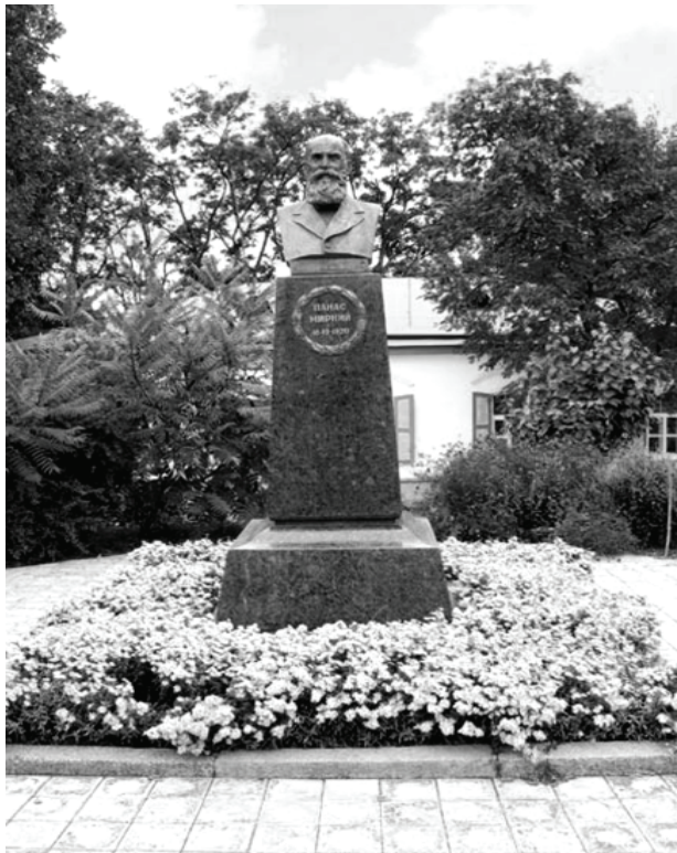
Пам'ятник Панасові Мирному на подвір'ї музею, відкритий 13 травня 1951 р.

Та й самого Михайла батько навчав прислухатися до народної мови, до співу, радив записувати цікаві прислів'я, приказки. Гово-