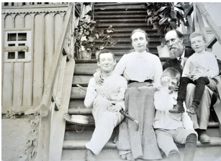
Панас Мирний у родинному колі. 1903 р.

На березі ставка Панас Мирний облаштував купальню. По інший бік від дубів поставили лавки, розташували їх у формі підкови. Хоч садиба й була обнесена огорожею, господарі дозволяли місцевим дітям ходити через хвіртку й купатися в ставку. А згодом навіть зро-