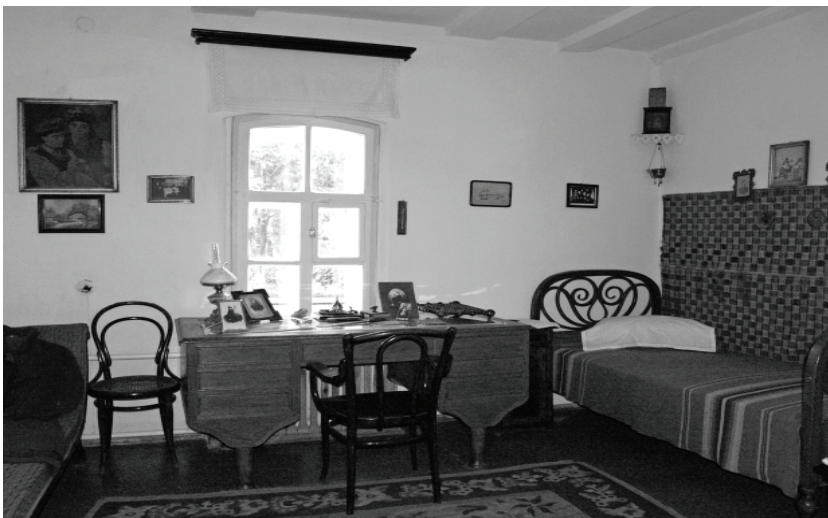
Музей Панаса Мирного. Кабінет

У 1990-х роках співробітники музею брали участь у роботі загальносоюзного семінару “Музей і підростаюче покоління” (Москва) і після того започаткували в Полтаві практи-