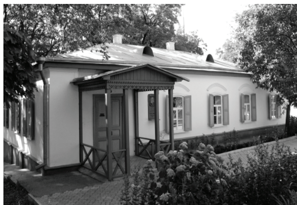
Будинок музею Панаса Мирного

Цей рік Панас Якович згадував як один із найщасливіших. Садиба зустрічала нових господарів зеленню саду, вабив джерельною водою ставок. Рай улітку та й годі! В одному