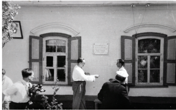
Закріплення меморіальної дошки на будинку Панаса Мирного в Полтаві. 22 травня 1949 р.

У сузір'ї імен письменників минулого воно сяє, як зоря першої величини» [1].