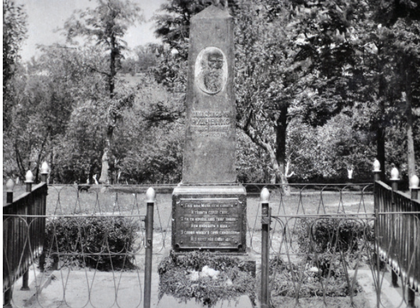
Могила Панаса Мирного. 1949 р.

са Мирного, над яким працювали молоді автори Макар Вронський і Олексій Олійник. Це було перше відтворення в скульптурі образу