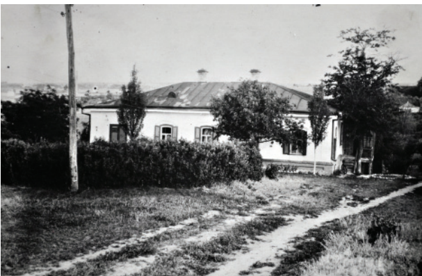
Будинок Панаса Мирного. Червень 1947 р.

Так усе починалося. А звідтоді українська громадськість широко – на державному рівні – святкувала 100-ліття, 125-річчя та 150-річчя від дня народження письменника. Із цими ювілейними датами тісно пов'язані й етапи розвитку, перебудови, розширення музею й поповнення його колекції.