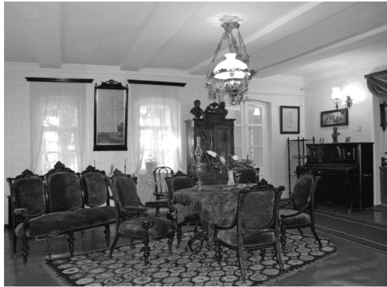
Музей Панаса Мирного. Вітальня

тави своїх кращих представників, нагадували часи, коли українські інтелігенти ділилися своїми планами, допомагали й підтримували