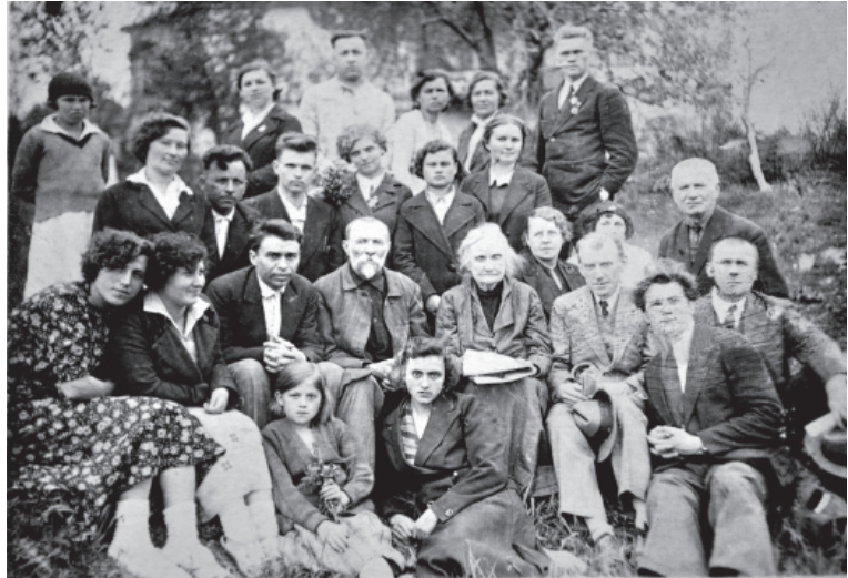
Перша екскурсія до музею Панаса Мирного студентів та викладачів Полтавського педагогічного інституту. 12 травня 1939 р.

до висновку про доцільність створення музею в оселі, де письменник провів останні 17 років свого земного шляху. У травні 1939 року Радою НК УРСР було винесено постанову про утворення в Полтаві літературно-меморіального музею Панаса Мирного.