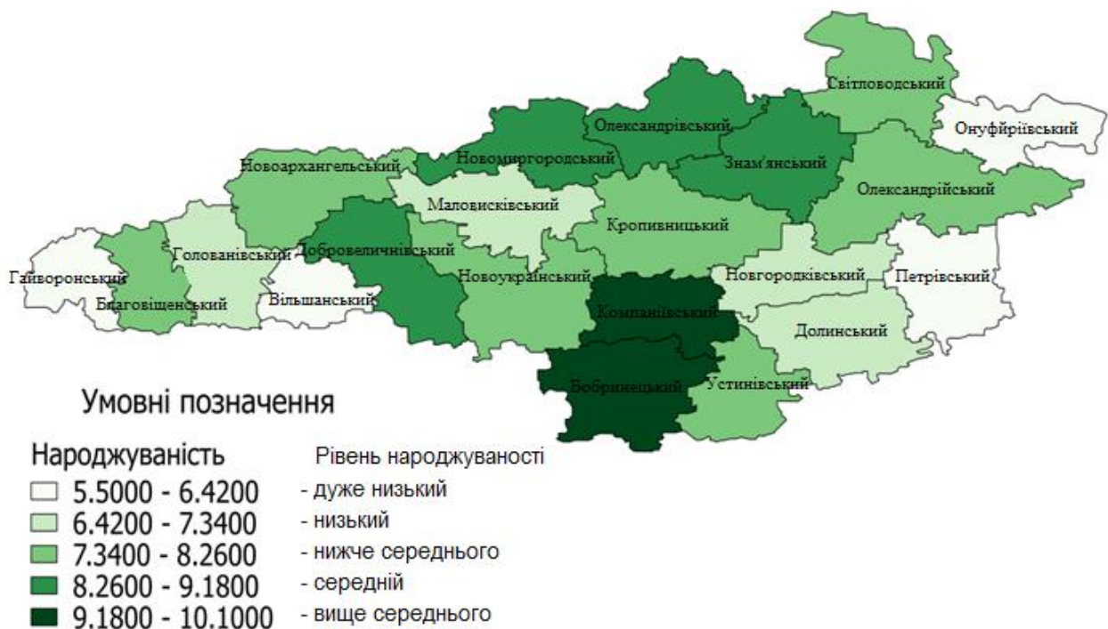
Рис.4. Коефіцієнт народжуваності в Кіровоградській області, 2018 р.

*побудовано автором на основі даних Головного управління статистики в Кіровоградській області