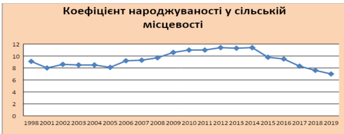
Рис. 3. Динаміка коефіцієнта народжуваності у сільських поселеннях Кіровоградської області, 1998-2019 рр.

У міських поселеннях динаміка коефіцієнта народжуваності упродовж 1998-2019 рр. мала коливальний характер. З 1998 р. до 2004 р. рівень народжуваності повільно зростав. У 2005 р. цей показник дещо знизився, що ймовірно пов'язано з суспільно-політичними заворушеннями в країні («помаранчева революція»). З 2005 р. рівень народжуваності продовжив тенденцію до зростання та досягнув максимальних за останні 20 років значень у 2009 р. та 2012 р. – по 10,8%. У 2013 р. рівень народжуваності у міських поселеннях дещо знизився, але в 2014 р. зафіксоване незначне його зростання. І, починаючи з 2015 р. в області спостерігається незмінна тенденція до зниження народжуваності і у 2019 р. коефіцієнт народжуваності сягнув своїх мінімальних значень – 6,6% [7] (рис. 2.).