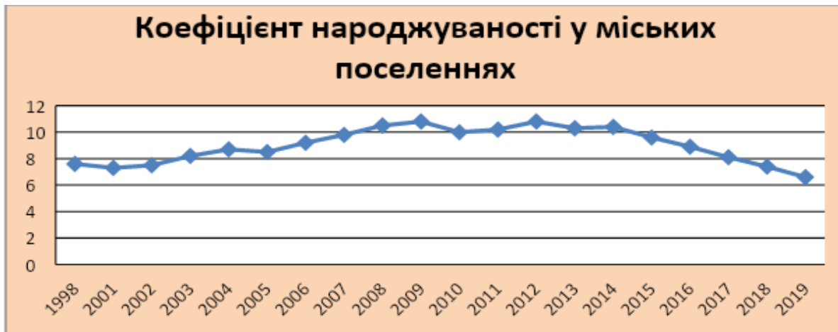
Рис. 2. Динаміка коефіцієнта народжуваності у міських поселеннях Кіровоградської області, 1998-2019 рр.

*побудовано автором на основі даних Головного управління статистики в Кіровоградській області