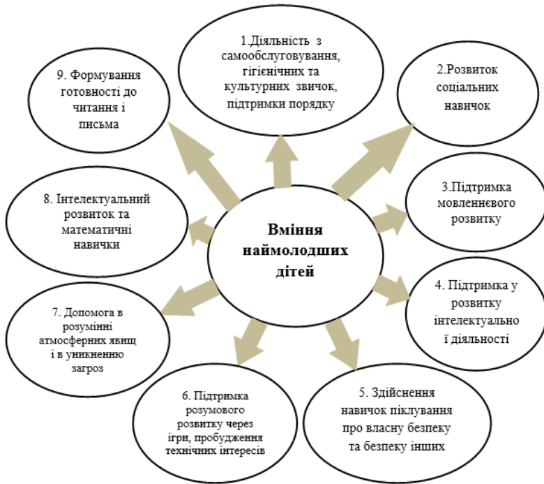
Рис.2. Сфери вмінь наймолодших дітей.

Найважливіші роки навчання починаються з народження. Мозок зазнає величезних змін, коли дитина розвивається і вчиться жити в навколишньому життєвому середовищі. У ці ранні роки мозок дитини зростає найшвидше, і здатний поглинати більше інформації, ніж у більш пізні періоди життя. Сфери розвитку, які охоплює дошкільна освіта, включають особистісний, соціальний та емоційний розвиток, спілкування: розмова та слухання, світові знання, творчий та естетичний розвиток, математичне усвідомлення, фізичне здоров'я та розвиток, ігри, командна робота, навички самопомоги, соціальні навички, наукове мислення, грамотність. Діти навчаються пісням, танцям, драмі, співам, іграм, малюванню, виготовленню плакатів.