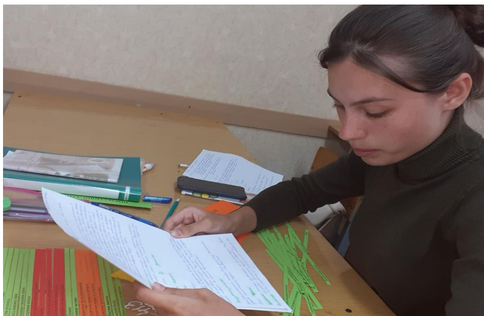
Фото 2. Студентка третього курсу складає презентує план-конспект за «Лінгводидактичним конспектом»