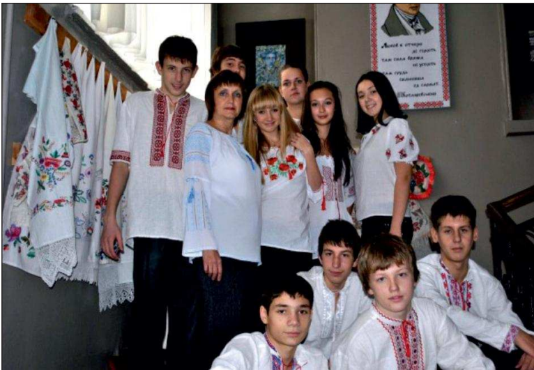
Із вихованцями – учнями Полтавського міського багатопрофільного ліцею №1 імені І. Котляревського