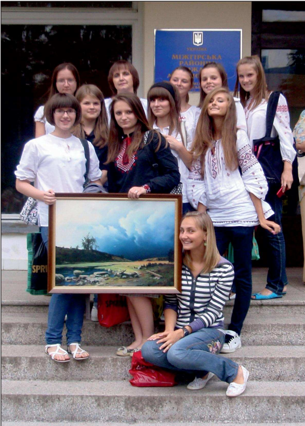
Із учасниками літературної студії “Перевесло”

ків. Це спонукає до подолання усталених стереотипів, застарілих цінностей і підходів, пошуку нового комплексу ідей, створення інтелектуальної основи школи ХХІ віку, школи самореалізації особистості, школи життєтворчості, полікультурного виховання на кращих досягненнях педагогіки світу”, – запевняє Тетяна Іванівна.