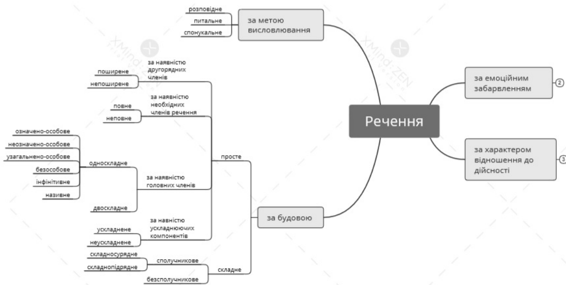
Рис. 1. Ментальна карта «Послідовність розбору речення».

На уроках української літератури у закладах професійно-технічної освіти ментальні карти доцільно застосовувати на етапі закріплення пройденого матеріалу. Вони підходять і для запам'ятовування великих обсягів інформації, і структурування прочитаного твору та його аналізу, і запам'ятовування основних фактів і слів, аналізування подій, характеристики образів, визначення проблематики у прочитаному тексті, підбиття підсумків тощо. Тобто йдеться не про звичайне запам'ятовування чи запис, а про осмислене сприйняття, швидше й глибше розуміння, що дозволяє відтворювати знання навіть через тривалий проміжок часу.