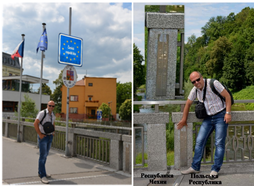
Рис. 1. Город Чешин (Польша, Чехия)

туристов. Например, границы между государствами Европейского Союза прозрачные, имеют формальный характер. В большинстве случаев какие-либо демаркационные разграничения отсутствуют, а если они и есть, то только из инициативы местных властей. Эти места являются наиболее посещаемыми туристами. Город Чешин является разделённым между Польшей и Чехией: одна часть города польская, а другая – чешская (рис. 1).