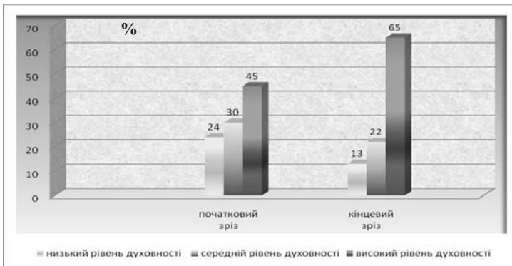
Рис. 2. Рівні розвитку духовності молодих викладачів («до» і «після» впровадження програми духовного становлення особистості)

Висновки та перспективи подальших розвідок. Нами представлено критерії, яким повинен відповідати молодий викладач: моральні : викладач мусить бути людиною релігійною; бути практикуючим християнином; мати об'єктивний та суб'єктивний авторитет; любити і поважати студентів, бути справедливим; мати педагогічний такт і радість від спілкування; інтелектуальні : високий рівень фахової підготовки; точність пам'яті, гнучкість мислення, творчість уяви; темперамент, лабільна нервова система (вроджені чинники); характер, воля (набуті чинники); мовленнєва культура, риторика; інтуїція; спостережливість; фізичні та канонічні : одяг, постава, поведінка; шляхетність, одухотвореність. Джерелами духовності для молодого викладача мають стати: книга книг – Святе Письмо; Богословіє (як наука про Бога); Свята Літургія – вчителька життя (А. Шептицький); Молитва – розвиток душі; церковне мистецтво; християнська філософія (пізнання Бога) тощо.