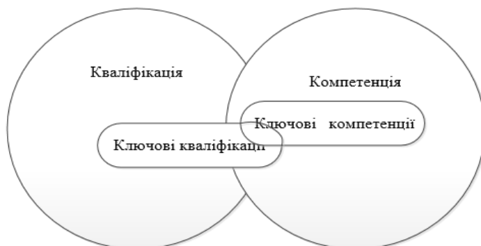
Рис. 1. Співвідношення понять «кваліфікація» та «компетенція» в теорії педагогіки

Кваліфікаційні вимоги до майбутнього лікаря регламентуються законодавчими документами. Такими документами є «Лікарська директива» Європейського союзу [11, Р. 481 – 482], Рекомендаціями Європейського Парламенту та Ради ЄС «Про основні компетенції для навчання протягом усього життя» та ін.