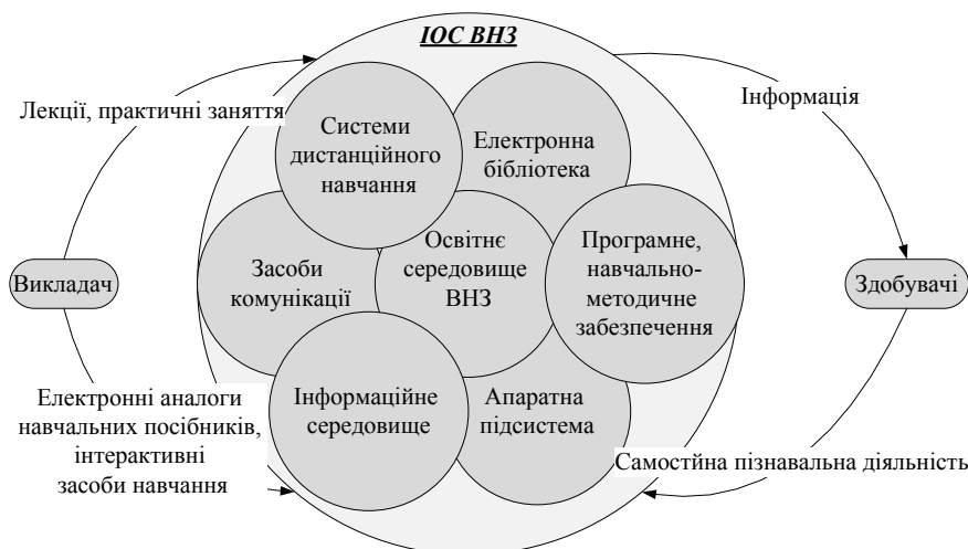
Рис. 4. Модель інформаційного освітнього середовища вищого медичного навчального закладу

Окрему увагу формуванню перелічених складових слід приділяти, на нашу думку, на третьому освітньо-науковому рівні вищої освіти, що характеризується, у свою чергу, поєднанням освітньої та науково-дослідної робіт у процесі підготовки. Наукова робота на даному етапі є предметом діяльності і вимагає нових підходів до її організації. Так, важливо ознайомити здобувачів освіти з основами роботи з Google Scholar, міжнародною мультидисциплінарною реферативною платформою Web of Science, програмою Mendeley, базою GenBank, світовим архівом послідовностей нуклеїнових кислот Protein Data Bank, електронно-пошуковою системою PubMed, базою даних медичної інформації MEDLINE та ін. Потреба у використанні вищевказаних ресурсів зумовлена необхідністю пошуку інформації для підготовки до практичних занять, роботи над індивідуальними завданнями. Усвідомлення важливості застосування даних ресурсів у навчанні трансформується у стійку мотивацію, а потім – і на переконання через використання їх для власного наукового пошуку.