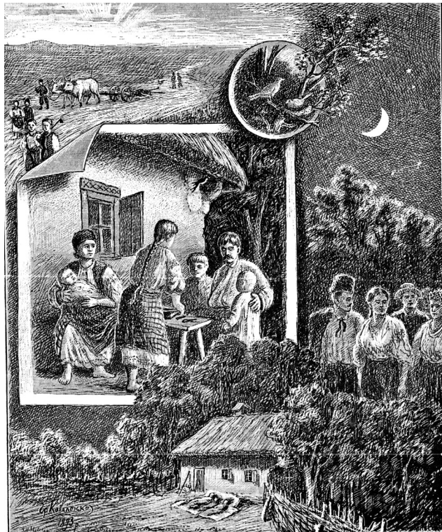
Григорій Коваленко. Ілюстрація до вірша «Вечір» Т. Шевченка

під псевдонімами Грицько Коваленко, Гр. Ков., Г. К., Гр. Вільний, К. Вільний, К. В., Гр. Липняцький; Андрій Очеретяний, Гр. Смутний, Гр. Сьогобочній, Гр. См., Г. Коваленко-Коломацький, Coval-co.